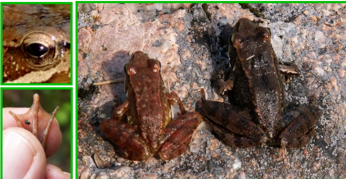
Ra patilonga ( Rana iberica )

Ra de pequeno tamaño, duns 4 cm., aínda que pode ser máis grande Cor dorsal parda, máis ou menos escura. Gorxa manchada de escuro cunha liña central clara. Membranas interdixitais grandes. Tímpano pequeno e case imperceptible.