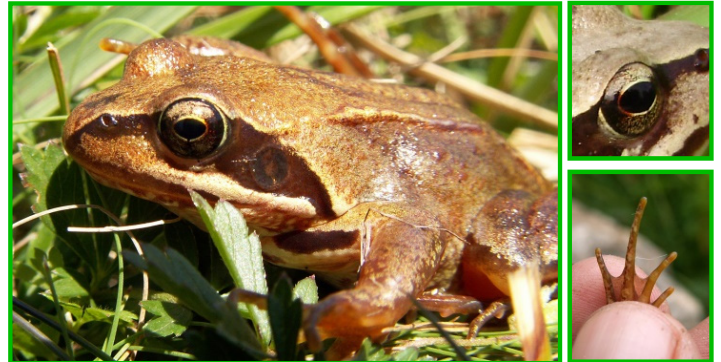
Ra vermella ( Rana temporaria )

Ra de tamaño mediano, uns 6 cm., aínda que poden chegar aos 9 cm. Cor dorsal parda avermellada ou ocre. Gorxa sen manchas ou con puntiños, sen liña central. Membranas interdixitais pequenas. Tímpano moi visible e case tan grande coma o ollo.