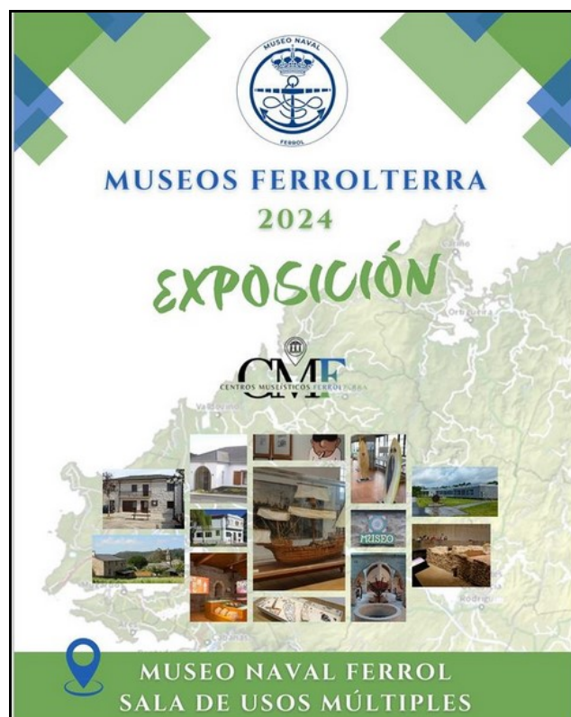
Cartel da vindeira exposición temporal no Museo Naval