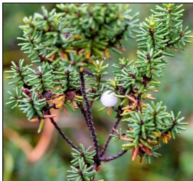
Camariña ou marmea (froito)

Houbo varias intervencións e preguntas arredor do estado de conservación da camariña , resultando unha sorpresa para o público que non figurase a día de hoxe contemplada na Categoría de Vulnerable no Catálogo Galego de Especies Ameazadas .