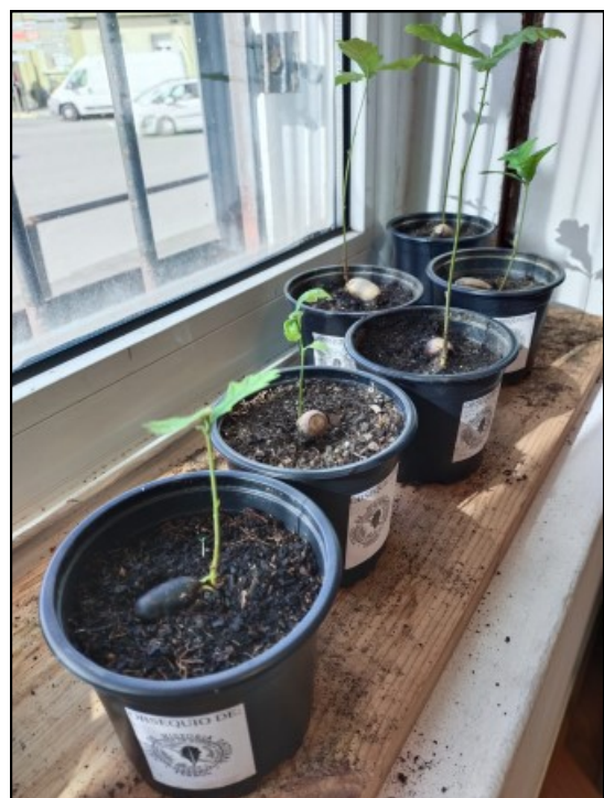
Carballiños agardando na recepción do Museo

Sobre o fungo parasito dos carballos, ver esta ligazón coa publicación da Universidade de Vigo ao respecto.