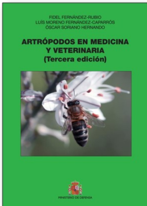
Portada do libro

Este libro está accesible para descarga completa na seguinte ligazón (92 Mb).